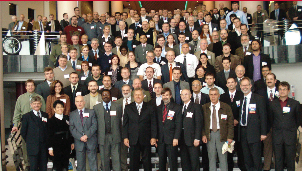
9ª Conferencia de Fumigantes y Feromonas, Bremen, Germany